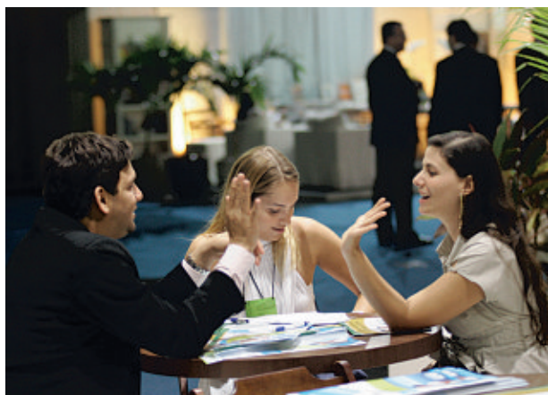
4ª edição do Salão Imobiliário