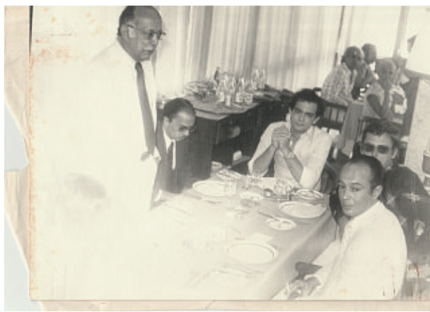
Confraternização ADEMI-BA de 1976

Amanhã a Ademi-BA celebra 48 anos de história. Em 13 de agosto de 1975, nascia a Associação de Dirigentes de Empresas do Mercado Imobiliário da Bahia. Nessa época, muitos bairros que redefiniram a capital baiana ainda não existiam. Não havia metrô, BRT, as praças que hoje estimulam a andabilidade e mobilidade, tendência mundial dos novos tempos. Em 48 anos, construímos juntos muitas transformações.