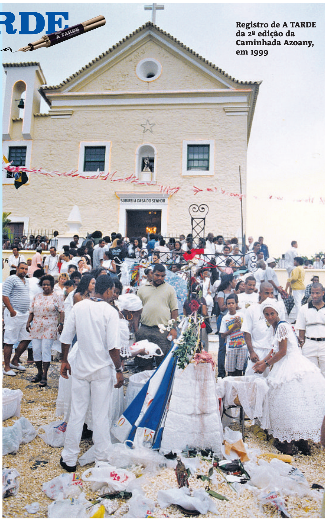
Registro de A TARDE da 2ª edição da Caminhada Azoany, em 1999

Manifestação realizada a cada dia 16 de agosto por comunidades de candomblé, a Caminhada Azoany agregou mais elementos da diversidade cultural à celebração pelo dia de São Roque. A TARDE registra a Caminhada desde a 1ª edição, em 1998. A7